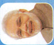
श्री नरेन्द्र मोदी माननीय प्रधानमंत्री, भारत

कृषि पशुपालन एवं सहकारिता विभाग, झारखण्ड